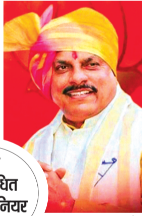
हटाए गए संबंधित चौफ इंजीनियर

मुख्यमंत्री डॉ. मोहन यादव ने कहा है कि अनन्यता (किसानों) का हित हमारे लिए सर्वोपरि है। किसानों के कल्याण के लिए हमारी सरकार पूरी प्रतिबद्धता से काम कर रही है। किसानों को हर हाल में 10 घंटे निर्बाध बिजली आपूर्ति की जाएगी। मुख्यमंत्री डॉ. यादव ने बुधवार को जारी संदेश में यह बात कही। मुख्यमंत्री डॉ. यादव ने कहा कि जिस सर्वरूलर को लेकर जनसामान्य में गलतफहमी पैदा हुई है, उस विवादित सर्वरूलर को तत्काल प्रभाव से निरस्त कर दिया गया है। साथ ही विवादित सर्वरूलर मामले से जुड़े संबंधित चौफ इंजीनियर को भी तत्काल प्रभाव से हटा दिया गया है। मुख्यमंत्री डॉ. यादव ने कहा है कि प्रदेश में