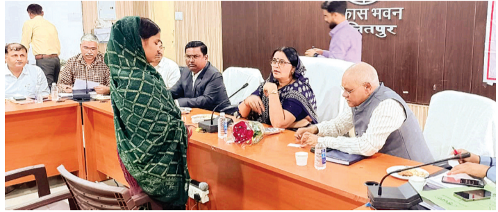
हरिभूमि न्यूज ललितपुर

अधिकारियों को शिकायतों का त्वरित व गुणवत्तापूर्ण निस्तारण कराने के लिए निर्देश